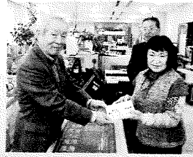
あおぞら広場出店者一同様 9,000円