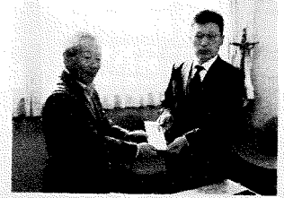
JANAがの志賀高原ブロック様 16,400円

お寄せいただいた寄付金は社会福祉基金に積み立てし、その果実を福祉事業に役立たせていただきます。温かいご厚志、誠にありがとうございます。