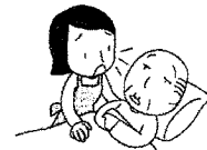
ぼうっとしている