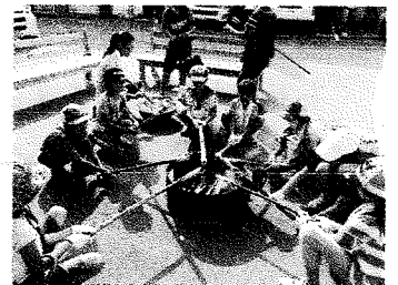
竹の先に生地をぬって焼く バームクーヘン作り