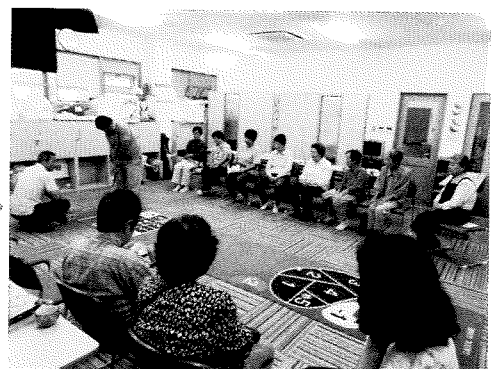
（9月はゲーゴル・ポッチャ・茶話会を実施）