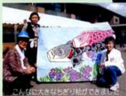
こんなに大きなちぎり絵ができました