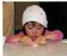
こんなにかわいいボランティアさんも(^o^)

ボランティア活動はそれぞれのグループや個人の活動になりがちですが、この日はボランティア活動に励むお互いを知ることによって今後の活動の活力となったようです。