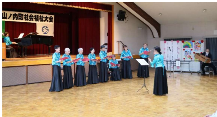
(コール・花音の皆様)