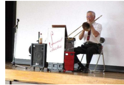
トランペット演奏