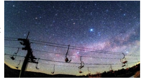
満天の星空が見えるかも