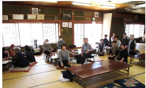
宇木いきいきサロン