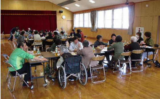
佐野長寿ふれあい会

町内のいきいきサロン各団体は、お花見などの4月行事を開催しました。 なお、各団体では今年度も様々な計画を予定しています。