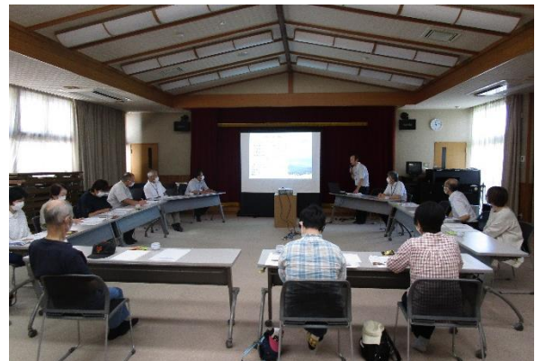
(ハートピアみよたでの講話)