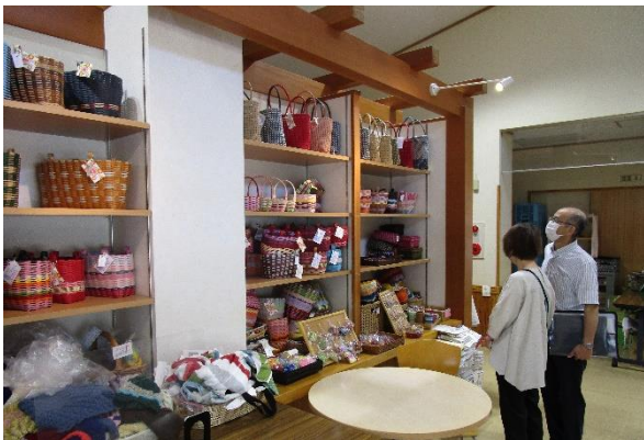
(手作り籠などを陳列している棚)

町手をつなぐ育成会としても御代田町の事例を参考にしながら、山ノ内町内における『生活支援サービス型』の有償ボランティア事業実現に向けて、山ノ内町社協との密接な連携を図って参ります。