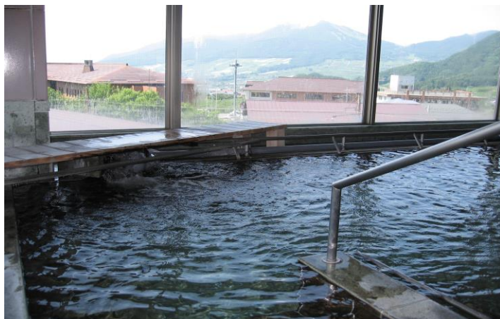
浴場からは四季変化する高社山を見ることが出来ます。