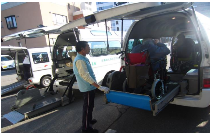
車椅子の方も安心して乗れるリフト車送迎